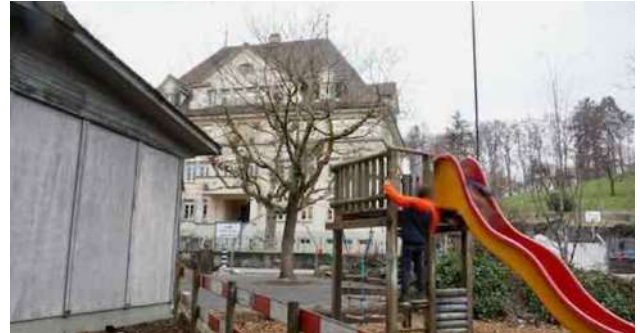
Ins Schulhaus Spiezmoos und die Kindergarten-Baracke muss endlich investiert werden.

Mit einer Senkung der Steueranlage in nächster Zukunft fehlen der Gemeinde Spiez für die Jahre 2025 bis 2029 Steuerausfälle von kumuliert 5,6 Millionen Franken. Die Politik wäre gefordert, eine Verzichtplanung anzupacken, statt längst fällige Investitionen zu tätigen.